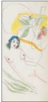
73. Toyen (Marie Čermínová)