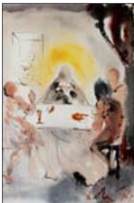
109. Salvador Dalí