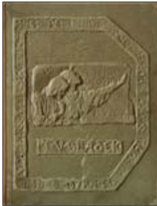
19. František Bílek